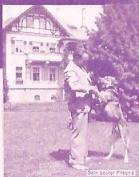
Der bester Freund