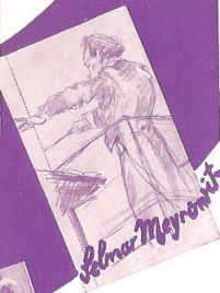
Vor dem Morgenrot