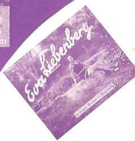
In ihrem Garten in Davos, 1930